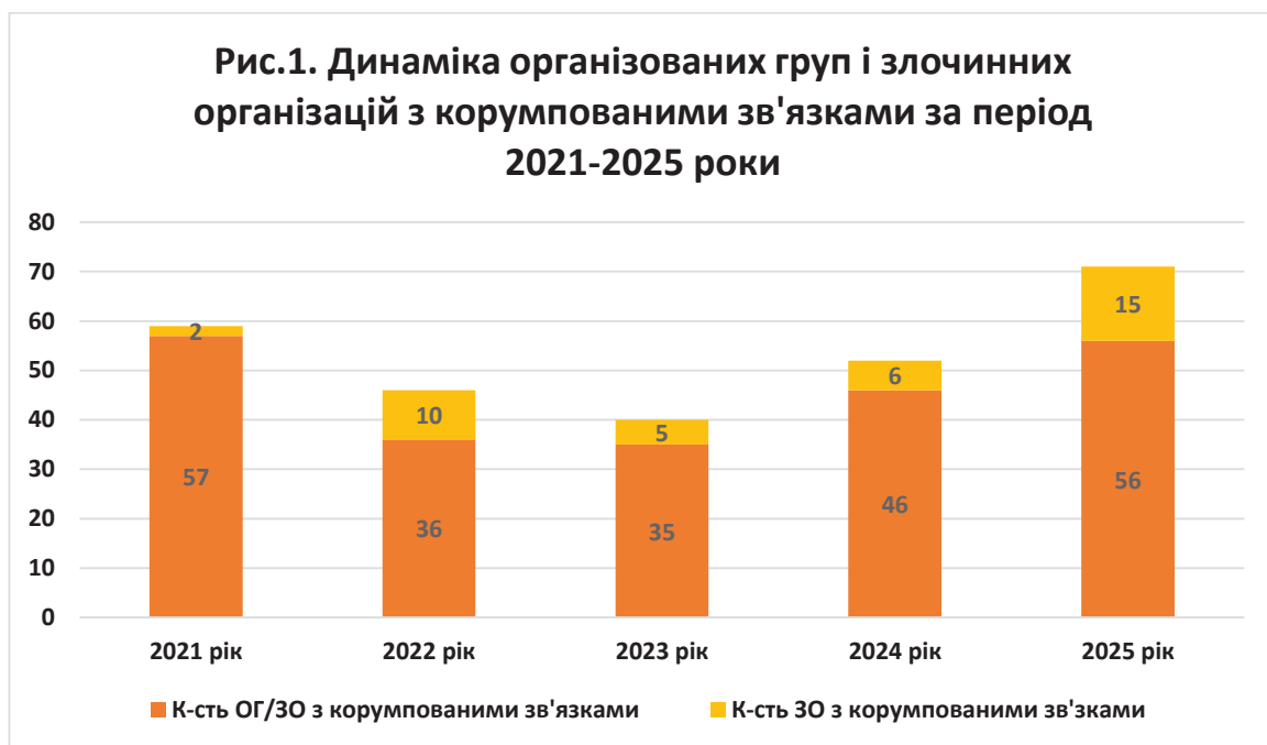
Рис.1. Динаміка організованих груп і злочинних організацій з корумпованими зв'язками за період 2021-2025 роки

Щодо динаміки осіб, які були учасниками ОГ та ЗО з корупційними зв'язками, то їх кількість із 2021 по 2023 рік стрімко зменшувалася: з 244 осіб (у 2021 р.) та 149 осіб (2022 р.) до 130 осіб (2023 р.), з подальшим різким зростанням у 2024 р. до 220 осіб та у 2025 р. – до 238 осіб. Ідентичні тенденції спостерігаються і щодо питомої ваги учасників ОГ та ЗО з корумпованими зв'язками від їх загальної чисельності: зокрема, їх частка становила 10,9% у 2021 р., 9,1% – у 2022 р., 6,2% – у 2023 р., 7,2% – у 2024 р. та 7,7% – у 2025 р. Водночас тенденції щодо учасників злочинних організацій із корумпованими зв'язками відображають швидке кількісне зростання (2021 р. – 18 осіб, 2022 р. – 23, 2023 р. – 33, 2024 р. – 69, 2025 р. – 70),